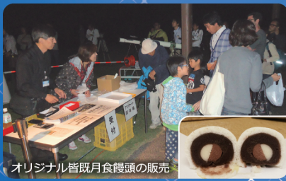
オリジナル皆既月食饅頭の販売

みさと天文台友の会に入会された方には、みさと天文台の機関誌「Mpc (メガパーセク)」を毎月お届けしています。