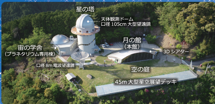
○名舎台長/佐藤文隆(京大名誉教授) ○全体計画/上田 篤(建築家) ○キャラクター製作/成瀬政博(画家)

ここはまさに奇跡の星空スポット。熟練のスタッフが星の魅せ方を天文学と観光との両面から常にリサーチし、皆様をお待ちしています。