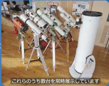
これらのうち数台を常時展示しています

天文一般に関するご質問のほか、お客様の双眼鏡や望遠鏡に関する個別相談もお受けします(要予約・無料)。望遠鏡・双眼鏡が