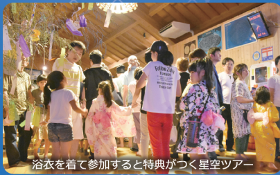
浴衣を着て参加すると特典がつく星空ツアー

星とみさと天文台を愛する人たちのボランティア団体です。独自の工夫で天文台オリジナル商品を開発したり、イベントを企画するなど、主体的に活動しています。天文台まで来られない方々のために、出張観望会も実施しています。